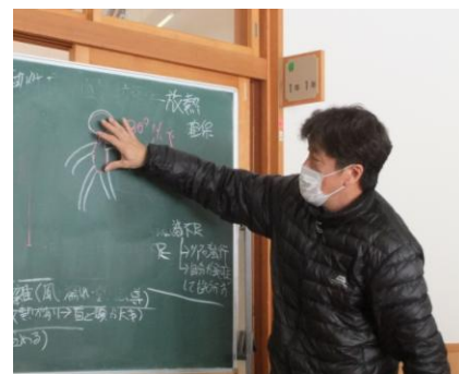
阿曾副会長（遭難対策）

遭難対策担当からは、低体温症の留意点、日本山岳協会遭難対策委員会研修会での内容から山のグレーディングについて体力度（縦軸）・難易度（横軸）を5段階に分け、新潟・山梨・信州・静岡の4県で統一したものが策定され、H28年7月1日から長野県登山安全条例が制定され登山計画書の提出が義務化されたことの報告があった。又、鳥海山では入山管理システムとして、スマホに「鳥海山アプリ」をインストールすることで、入山届や下山届が容易に管理され、