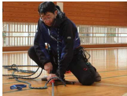
SAB手順確認 (高取副部長)