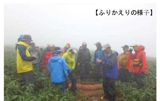
【ふりかえりの様子】