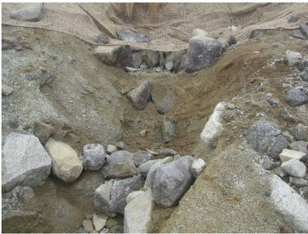
施工箇所① 土留工を設置