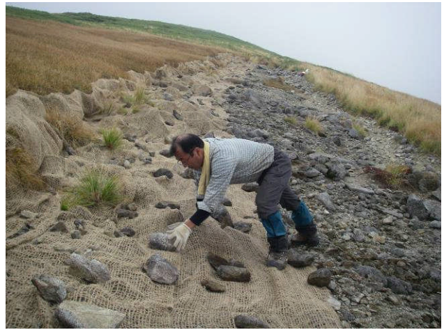
緑化ネットを敷設し、上から転石を置きます