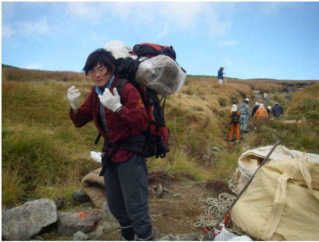
緑化ネットを施工箇所まで運搬します