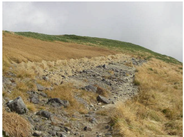
施工箇所① 作業終了